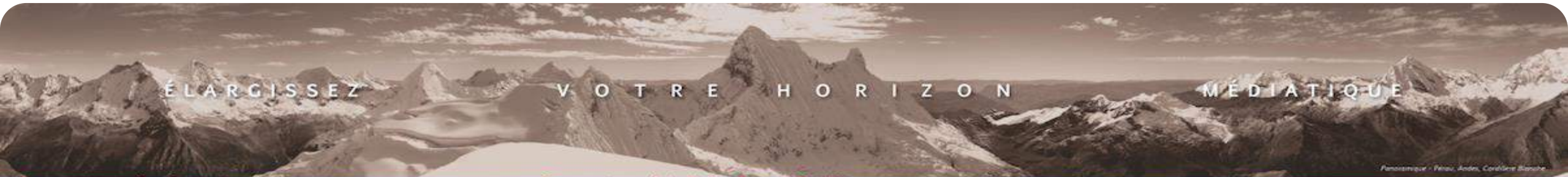
Panossique - Fenau, Andes, Cordillère Blanche